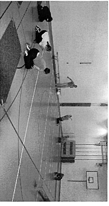
Konzentriert: Damit die Spieler den Ball orten können, muss es rund ums Torballfeld still sein.

Dieses Portrait ist im Rahmen der berufsbegleitenden Journalistenausbildung am Medienausbildungszentrum (MAAZ) in Luzern entstanden und wurde als Diplomarbeit eingereicht.