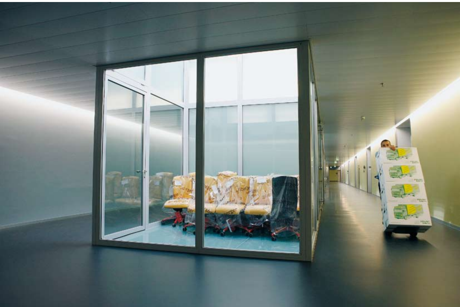
Zügeltermin: vier von insgesamt 3500 Umzugskisten auf dem Weg zu ihrem Bestimmungsort im Spitalneubau

jetzt stehen und die so steril wirkt wie die Schalterhalle einer Bank. Esther Hofmann dreht sich langsam im Kreis, als würde sie auf einem Berg stehen und die Aussicht