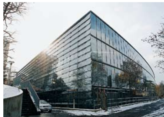
Prunkstück: Der Neubau des Inselspitals kostet über eine Viertelmilliarde Franken.