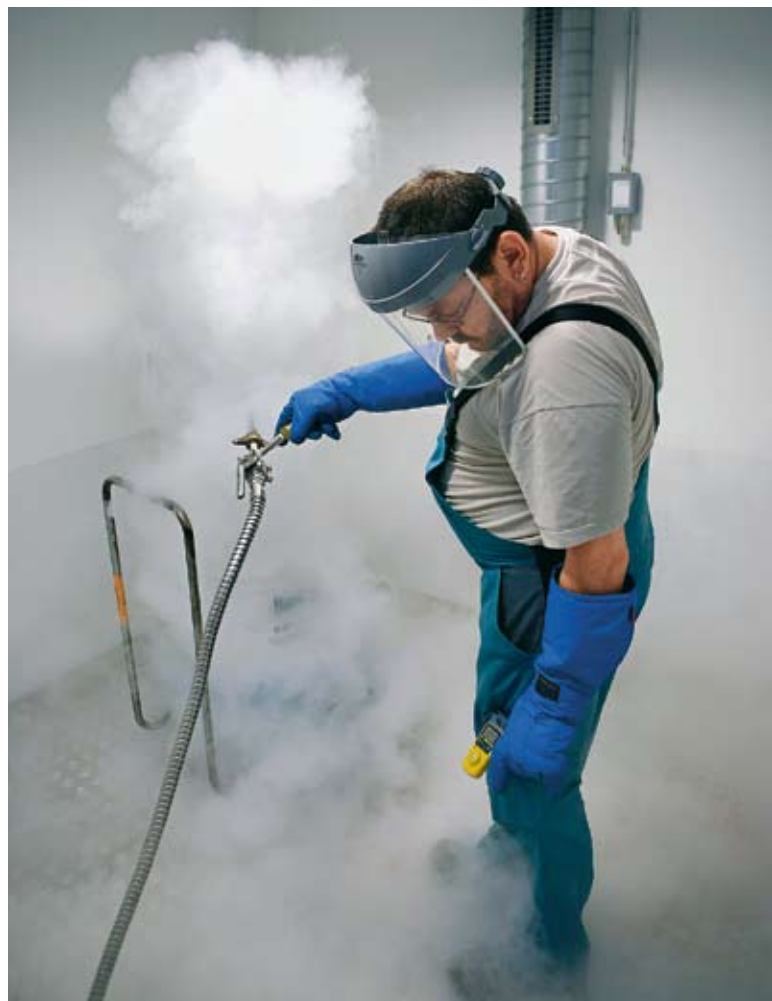
Das Protokoll eines Stickstofftests: Fachleute überprüfen den neuen Aufbewahrungsraum für die Stammzellen der Krebspatienten.

Extrem. Letztlich sei es auch ganz einfach eine Frage der Grundhaltung, ob man Pessimist oder Optimist sei.